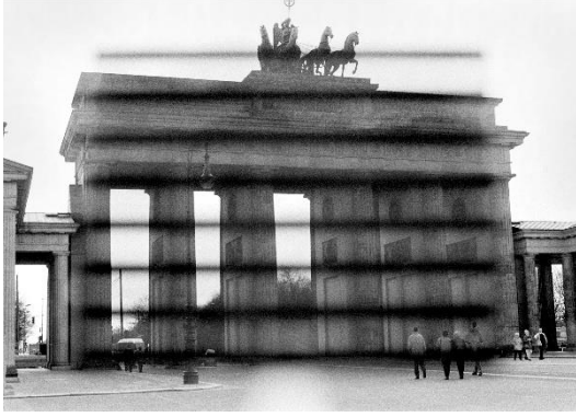
Kurt Buchwald_Das Tor_Aus der Serie_End of History.tif Kurt Buchwald, Das Tor, Aus der Serie: End of History, Berlin 1994, Fotoabzug auf Barytpapier