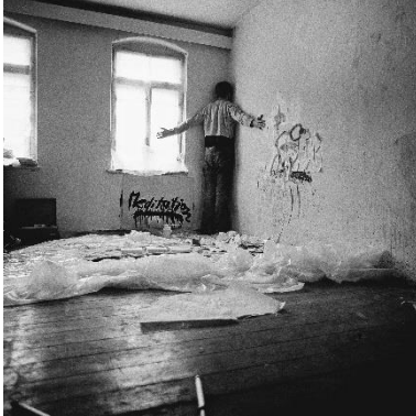
Erich-Wolfgang Hartzsch_Meditation.jpg Erich-Wolfgang Hartzsch, Meditation © Erich-Wolfgang Hartzsch