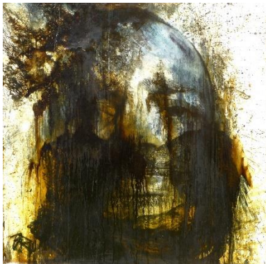
Micha Brendel_Vier letzte Bilder IV.jpg Micha Brendel, Vier letzte Bilder IV, 1988-90, Silber-Gelatine-Handabzug, Öl, Asphalt, Tusche, auf Hartfaserplatte 100 x 100 cm © Micha Brendel