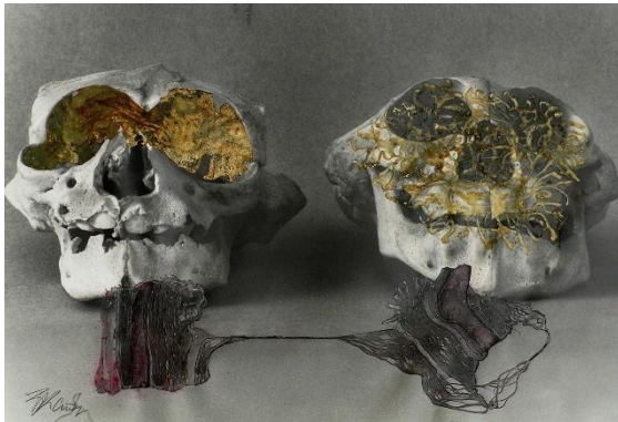
Micha Brendel_Aus der Serie_Anencaphlie_Nr. 7.jpg Micha Brendel, Aus der Serie: Anencaphlie, Nr. 7, 1992, Haut, Beizen über Gelantinesilber-Fotografie, 54 x 75 cm

Die Pressebilder stehen auf www.oekultur.at zum Download bereit. Lizenzfreie Nutzung nur unter Angabe des Bildrechts und nur im Rahmen der aktuellen Berichterstattung erlaubt.